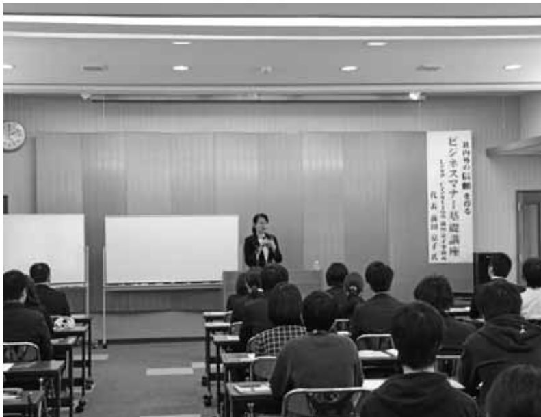
4月21日 新入社員セミナー