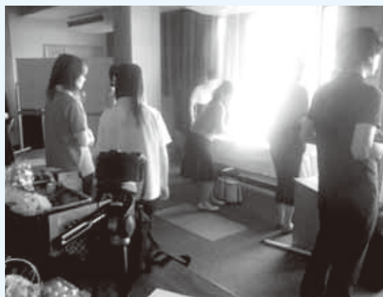
9月14日(月)開催の商品撮影セミナーの様子