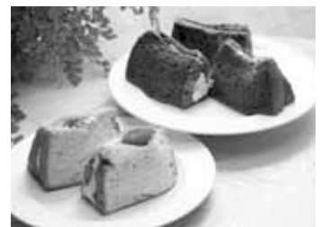
当店自慢のシフォンケーキ