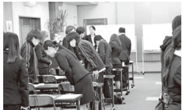
4月21日 新入社員セミナーの様子