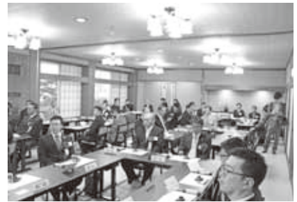
海南YEG創立30周年記念式典