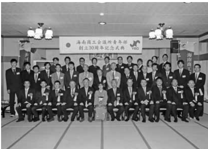
5月20日 青年部創立30周年記念式典