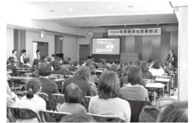
フラッシュ暗算に挑戦する生徒と家族の皆さん