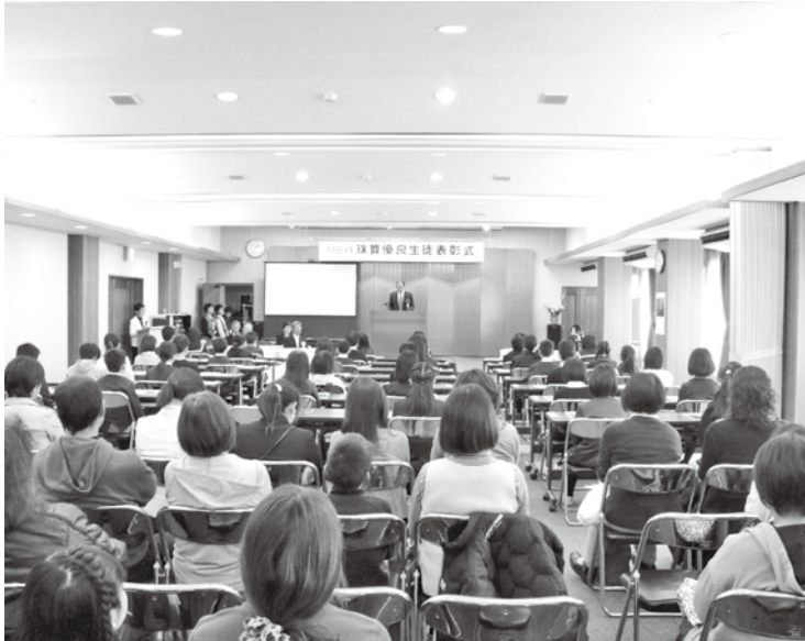
3月26日 珠算優良生徒表彰式