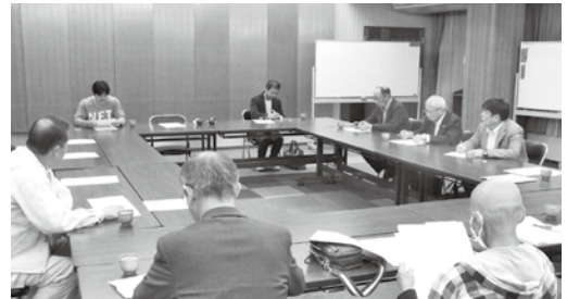
イベント内容を考える委員の皆様

かいなん夢風鈴まつり実行委員会は今後も参加者の皆様楽しんでいただけるイベントを考え、実施していきます。