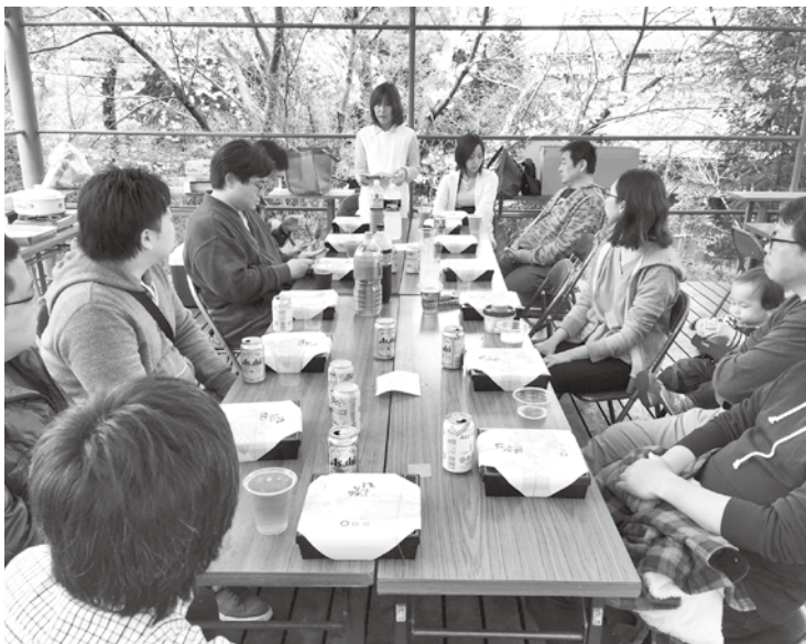
4月8日 青年部花見大会