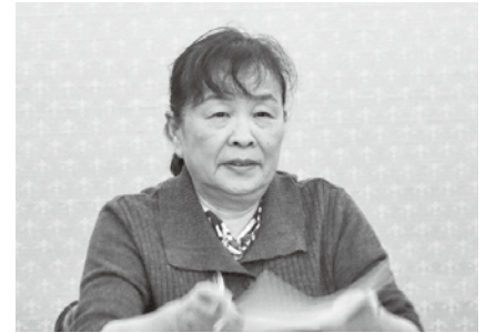
神出会長による挨拶

平成28年度は、講師を招いた染物教室やハンドメイドリース作りを開催し、視察研修では大阪市立美術館やニフレルなどを訪れ、活発に活動してきました。