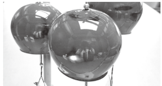
新作夢風鈴「根来塗り風鈴」