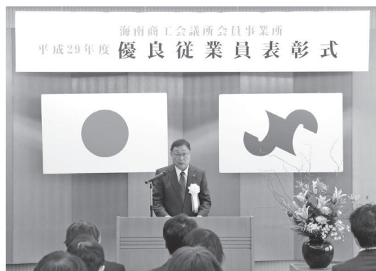
平成 29 年度 表彰式の模様