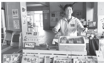
11月5日 あり長さんによる直売会