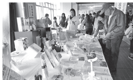
11月4・5日 家庭用品まつりにて展示