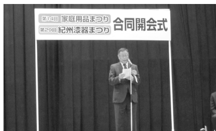
神出会頭による挨拶

まつり当日、漆器まつり(川端通り)には4万4千人、家庭用品まつり(海南市総合体育館)には2万9千人の方が来場され、各イベント観覧や漆器、家庭用品などを買い求められるなど盛況に開催されました。