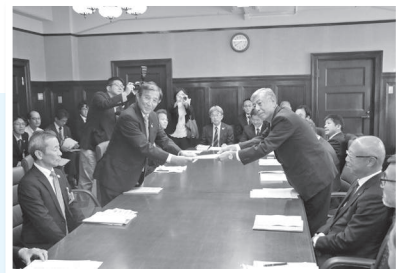
和歌山県庁知事室での要望活動