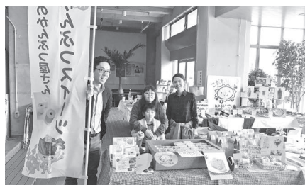
11月4日(株)野田商店さんによる直売会

また、4日は(株)野田商店さんが、5日にはあり長さんが来場者に直接販売する販売ブースで商品を販売しました。