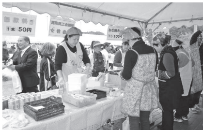
11月4日 模擬店の様子

今年もフリーマーケットと模擬店で出た収益の一部を、海南市の福祉増進のために役立ててもらうため、海南市社会福祉協議会へ寄付させていただきました。