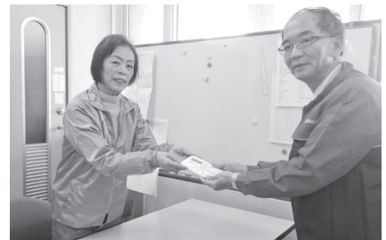
11月22日海南市社会福祉協議会へ寄付