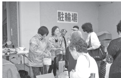
11月4日 フリーマーケットの様子