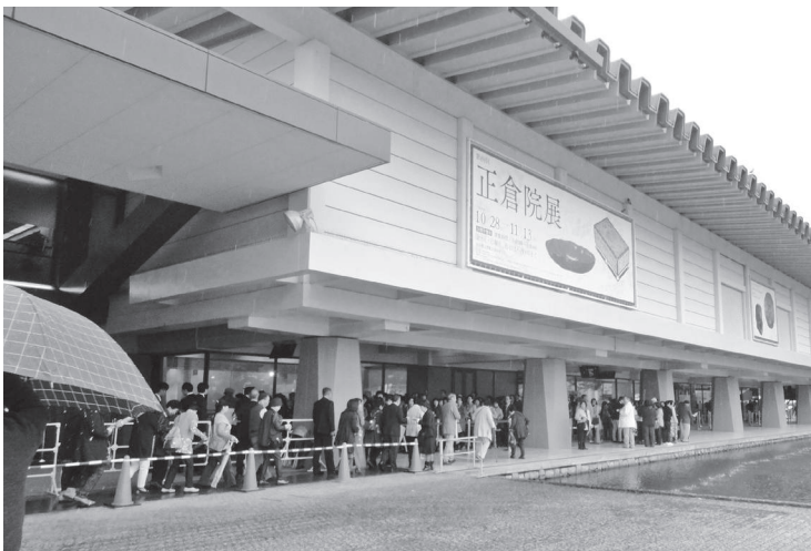
10月29日 会員大会（奈良国立博物館）