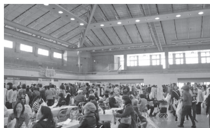
家庭用品まつり(海南市総合体育館)