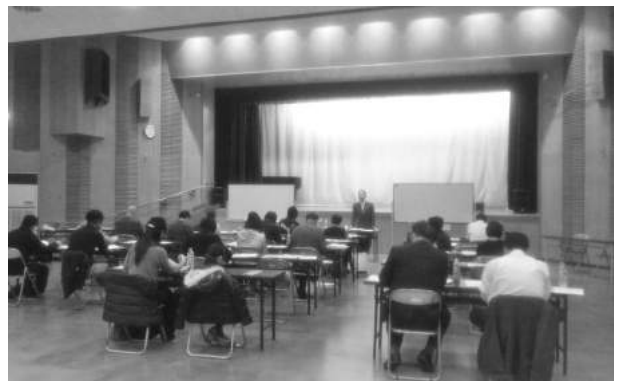
11月18日 創業セミナー

また、18 日セミナー終了後には懇親会が開催され、参加者同士の交流を深めました。