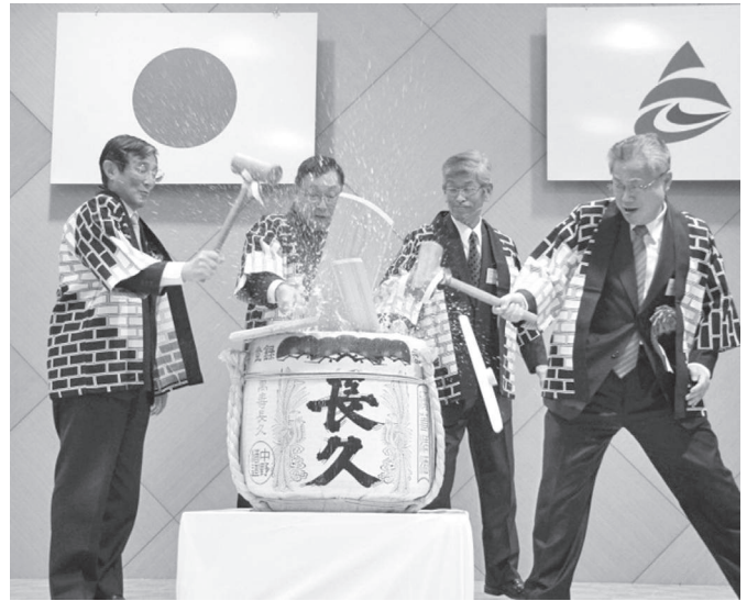
平成29年新年賀会の様子