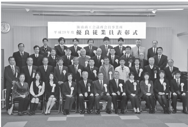
11月21日 優良従業員表彰式