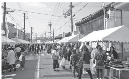
紀州漆器まつり(川端通り)