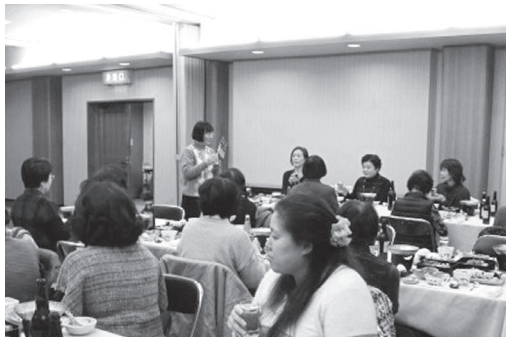
本田副会長による乾杯の挨拶

また、懇談会では「紀州海南ひなめぐり」の開催案内や、県内事業、来年度事業などについて意見交換が行われ、会員相互の親睦を深めることができました。