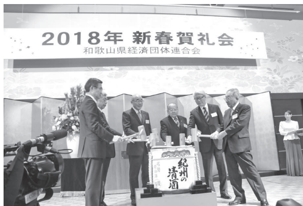
1 月 5 日 新春賀礼会

その後、仁坂吉伸県知事が祝辞を述べられ、鏡開きのあと食事を交えながら新年をお祝いしました。