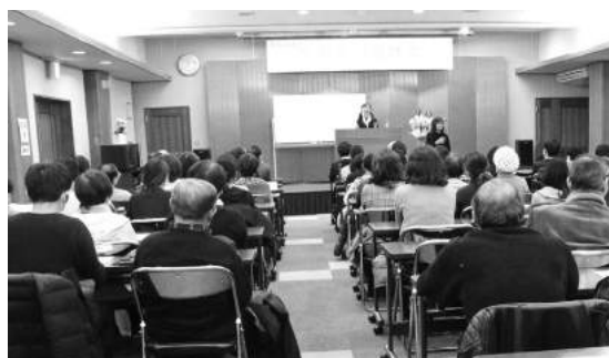
新春講演会の様子