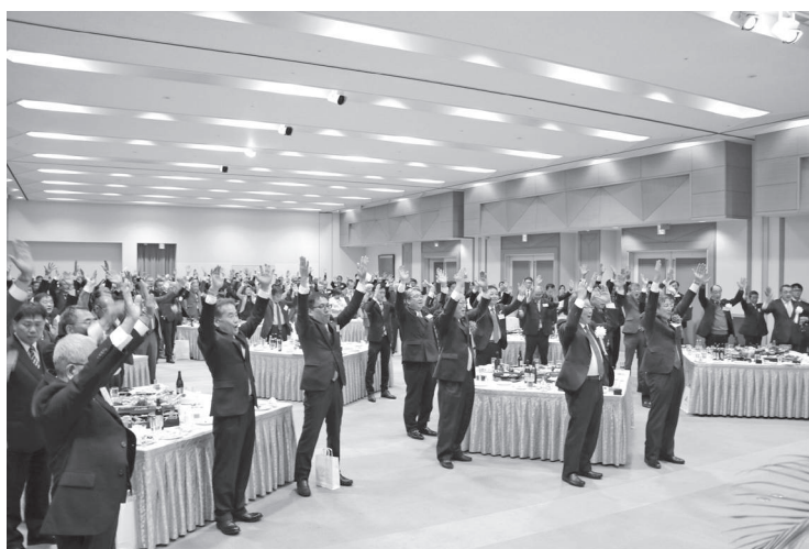
1月4日 平成30年新年賀会