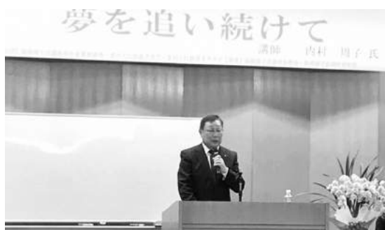
神出会頭による開会の挨拶