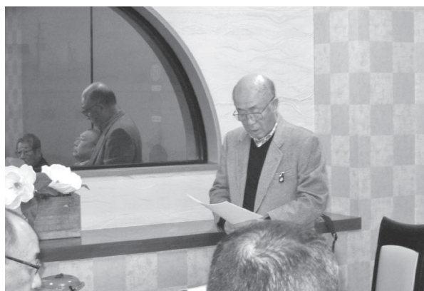
1 月 22 日 選挙管理委員会

また、会の終了後には正副会頭との懇親会を開催し、忌憚のない意見交換がなされました。