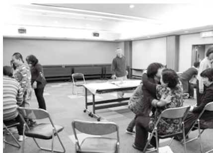
椅子からの立ち上がり介助