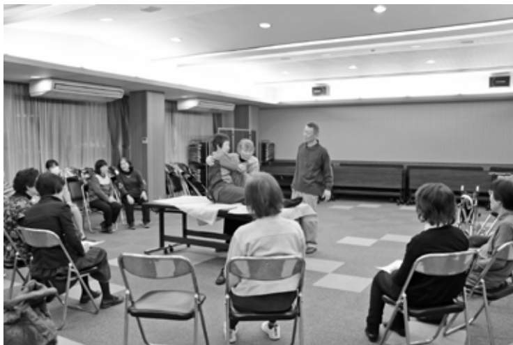
3月14日 女性会 介護講習会