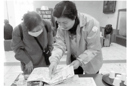
来られた方への案内