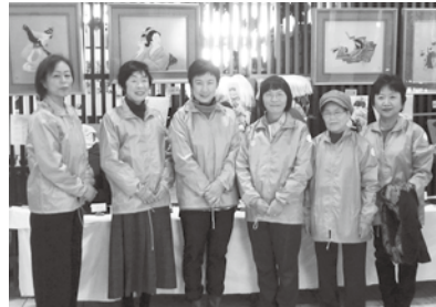
2月24日 参加者の皆さん