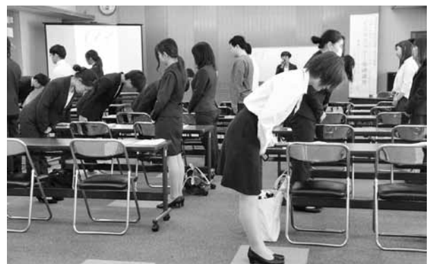
お辞儀のポイントを学ぶ