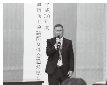
神出会頭による挨拶