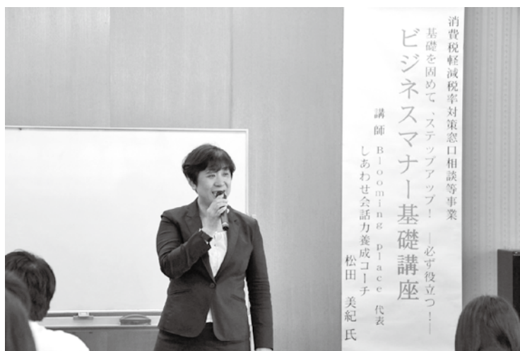
5月22日 ビジネスマナー基礎講座