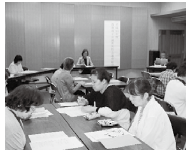
5月9日 平成30年度通常総会