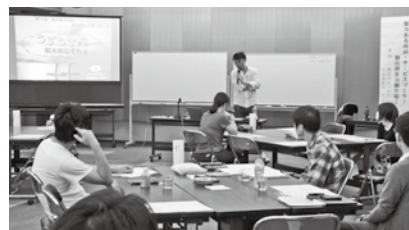
「個店潜在力掘り起こし塾」（5回開催）