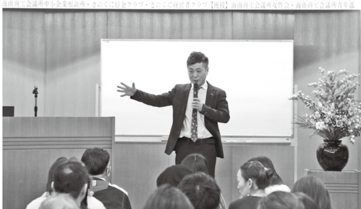
新春講演会 (1月29日 当所 4F 大ホール)