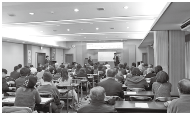
新春講演会の様子