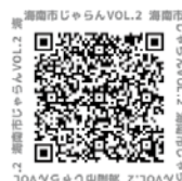
じゃらん VOL.2 WEB用 デジタルパンフレット（QRコード）