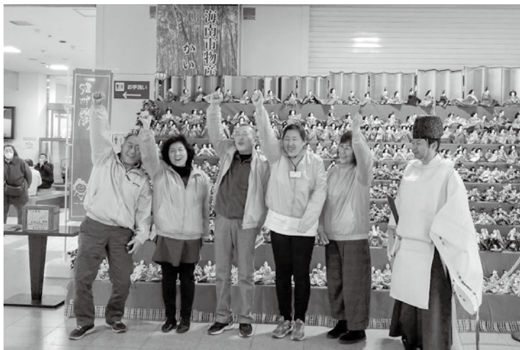
第9回紀州海南ひなめぐり出発式 (2月15日 JR 海南駅)