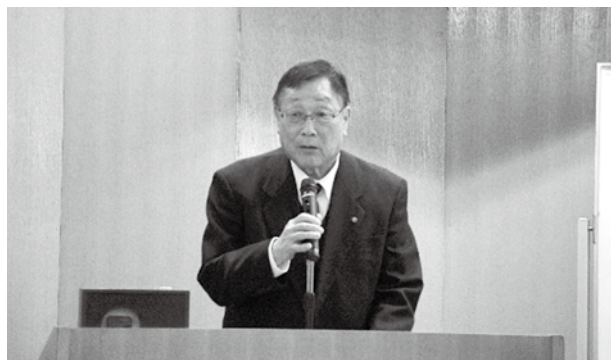
神出会頭による開会の挨拶