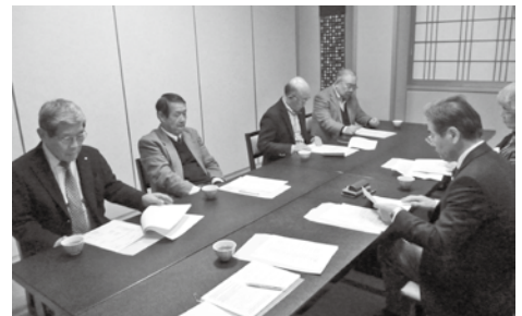
2月8日 選挙管理委員会

また、会の終了後には神出会頭との懇親会を開催し、忌憚のない意見交換が行われました。