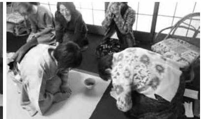
2月13日 お茶体験教室