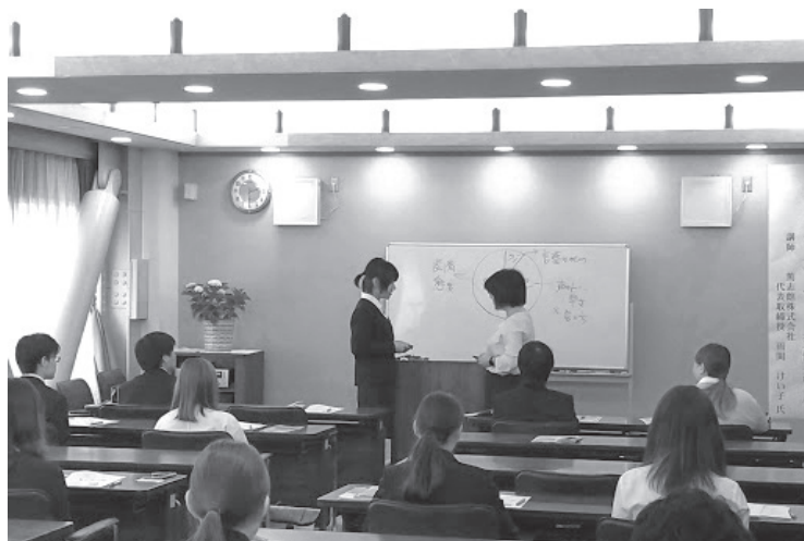
5月28日 ビジネスマナーセミナー