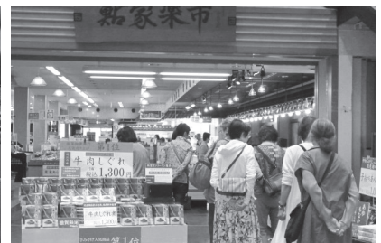
びわ湖鮎家の郷でお買い物