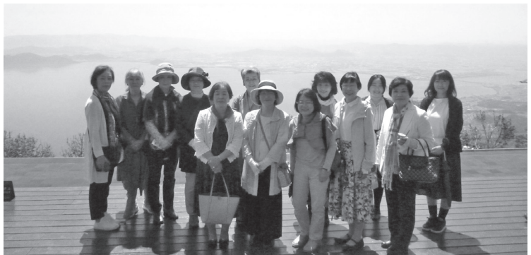
びわ湖バレイでの集合写真

その後バスで移動し、宝山園にて昼食をとった後、びわ湖鮎家の郷やラコリーナ近江八幡でお買い物を楽しみました。