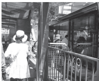
びわ湖バレイ ロープウェイ乗車