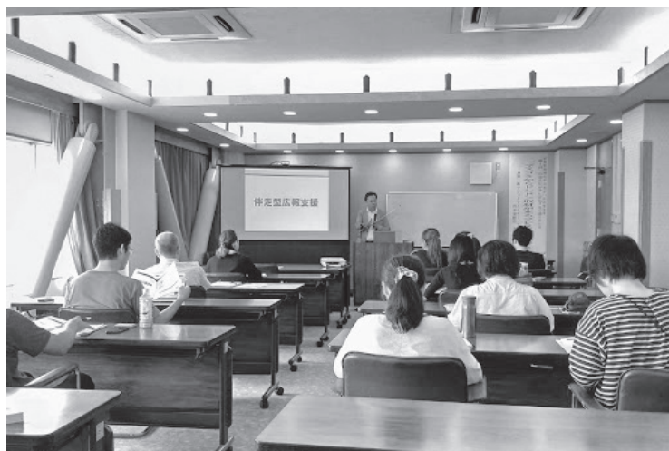
6月6日 プレスリリースセミナー