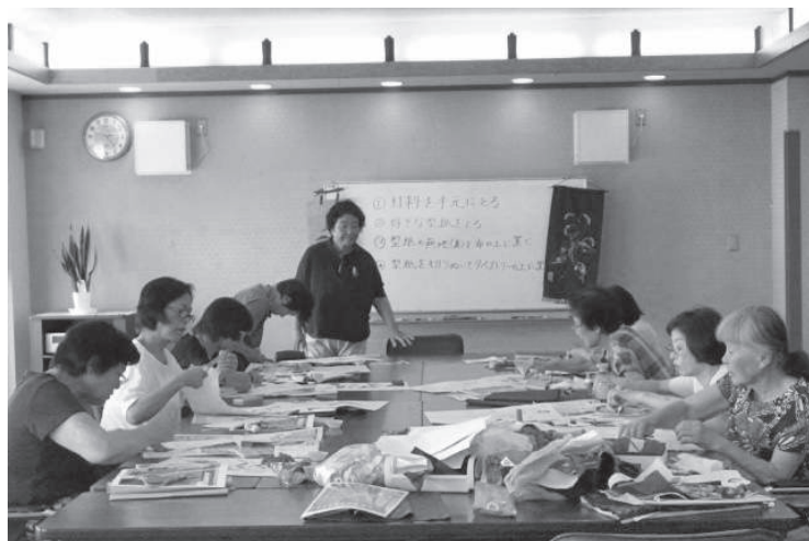
7月25日 女性会タペストリー作り教室