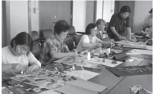
7月25日 タペストリー作り教室