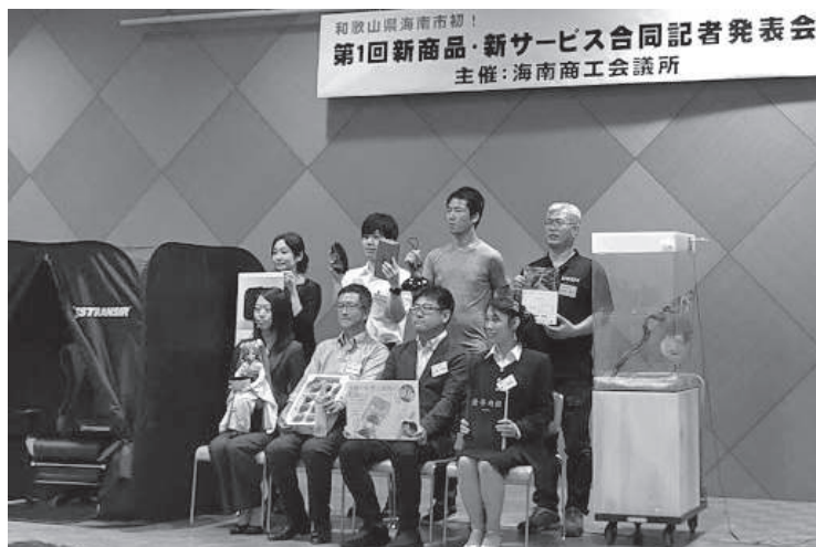
7月31日 新商品・新サービス合同記者発表会