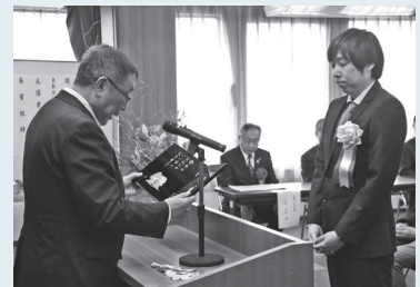
昨年度の表彰式の様子