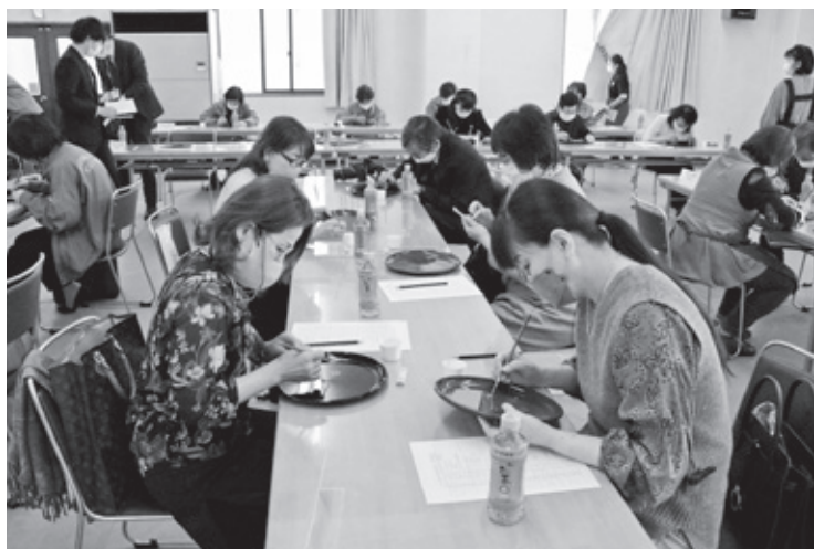
11月4日 県内商工会議所女性会 蒔絵体験講習会(記事P12)