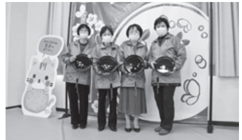
▲ 素敵な「マイ盆」ができ上がりました