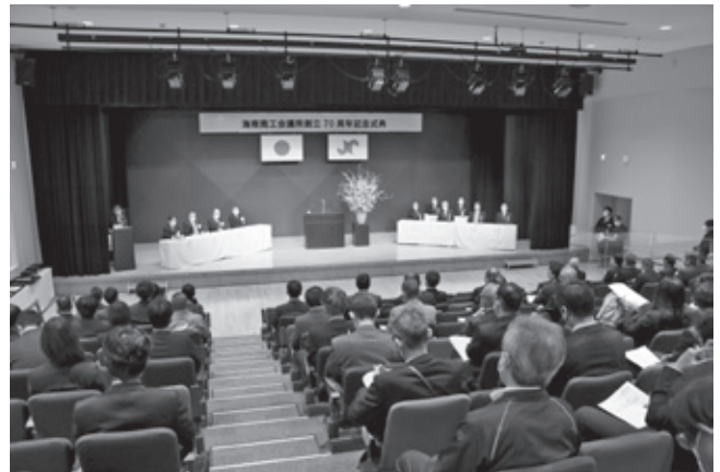
▲ 創立70周年記念式典会場