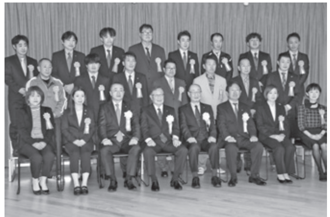
▲ 優良従業員表彰受表彰者

私たちKYOWAは、50年以上の実績に裏打ちされた知識と経験を基に広告・印刷のコンシェルジュとして、お客様のご要望を解決できる“鍵”をご提供いたします。