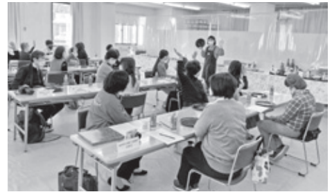
▲ 蒔絵体験講習会の様子

参加者からは、「とても楽しく、紀州の伝統工芸品づくりという貴重な体験ができた」や「細かい作業をし、久しぶりに緊張し手が震えた」、「家族や友達にも体験させてあげたい」などの意見が挙げられました。