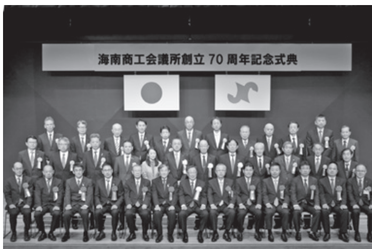
11月22日 創立70周年記念式典(記事P2・3)