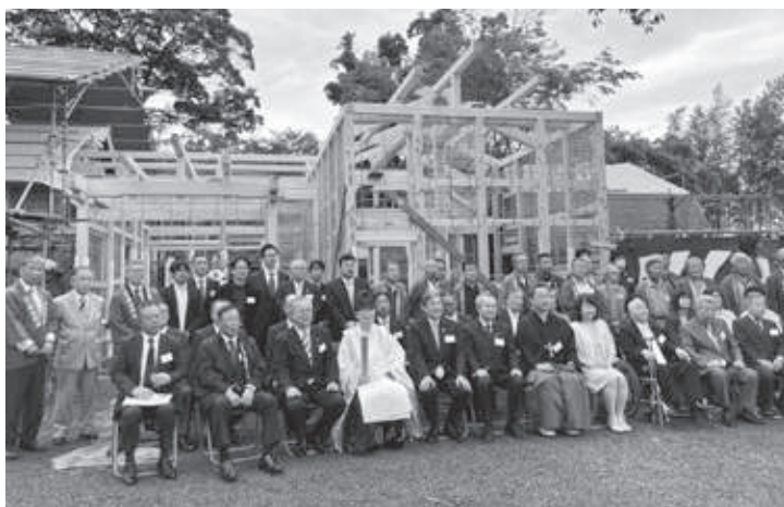
5月14日 鈴木屋敷 上棟式(記事P.3)