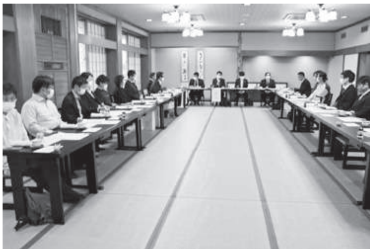
5月20日 青年部通常総会(記事P.11)