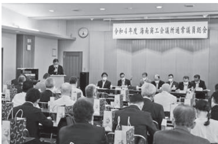
6月25日 通常議員総会(記事P.2)