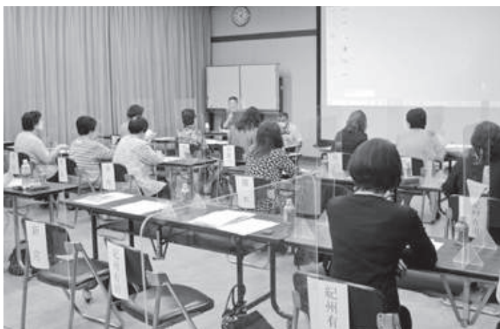
7月4日 女性会県内事業(記事P.14)