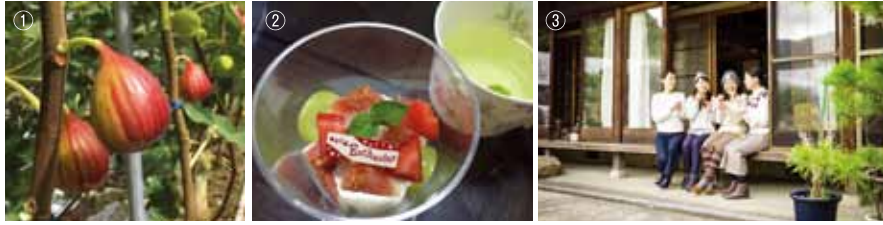
①低いところに実がなっているので収穫しやすい②収穫したての完熟イチジクでスイーツづくりもできる！③隣接した築70年の家屋の縁側でスイーツをいただきませす！④ハウス栽培なので、雨でも心配ご無用。収穫の仕方、食べ方は農園オーナーが丁寧に教えてくれる