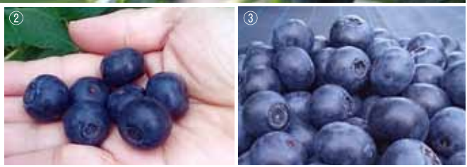
①とっても気さくな農園オーナー。「なんでも聞いてね♪」 ②③見よ！この大きさを！直径2cmにはなろうかという粒の大きさ