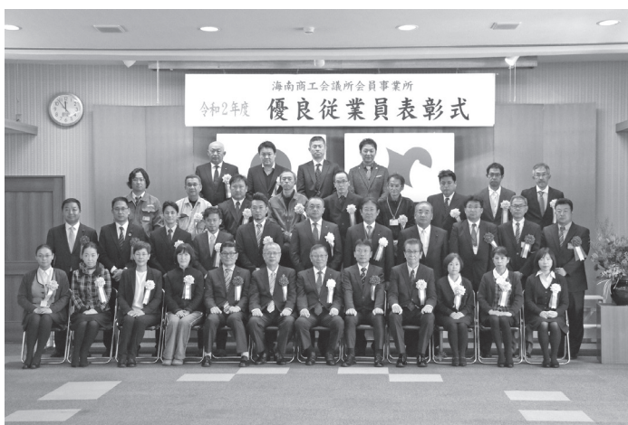
11月24日(火) 令和2年度 会員事業所優良従業員表彰