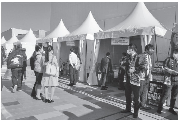
令和2年11月5日(木)・6日(金) 2020“よい仕事おこし”フェア