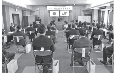
優良従業員表彰式の様子